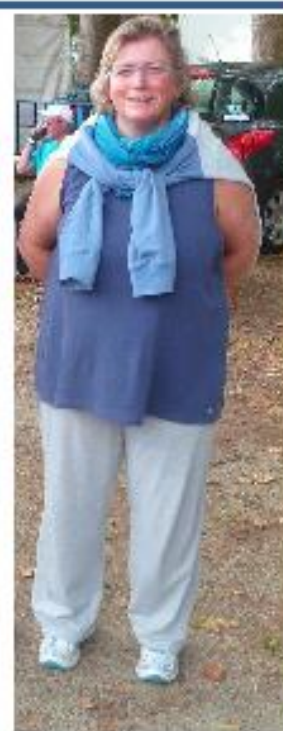
Soissons le 25 Sept

Une petite nouvelle ou plutôt une revenante a rejoint les rangs des nageurs et représente seule le CPSQY à Soissons le 25 Septembre et à Migennes le 6 Octobre